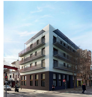
EDIFICI PLURIFAMILIAR EN TESTERA DE 10 HABITATGES I TRASTERS Av. Marquès de Mont-roig, 1-5. 08912. Badalona

Les característiques de l'habitatge i les seves instal·lacions estaran supeditades a les exigències de les normatives vigents, així com a les solucions tècniques determinades per la direcció facultativa. Tot això pot donar lloc a possibles modificacions d'aquest plànol i infografies. El mobiliari, vegetació i elements de decoració representats són merament orientatius i no estan inclosos en els habitatges. Aquest plànol no té validesa legal.