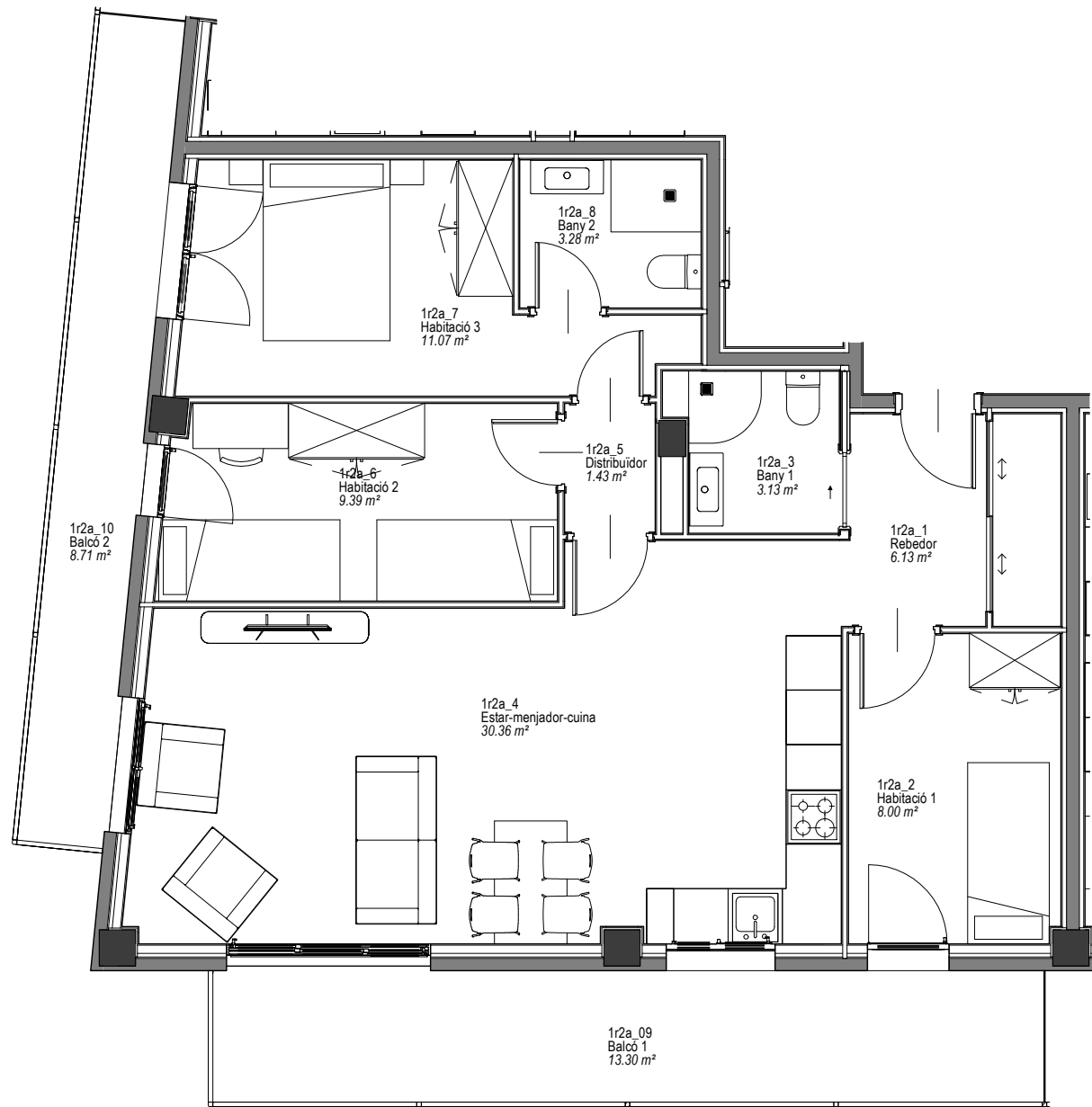
HABITATGE 1r 2a Planta primera